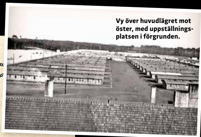
Vy över huvudlägret mot öster, med uppställningsplatsen i förgrunden.