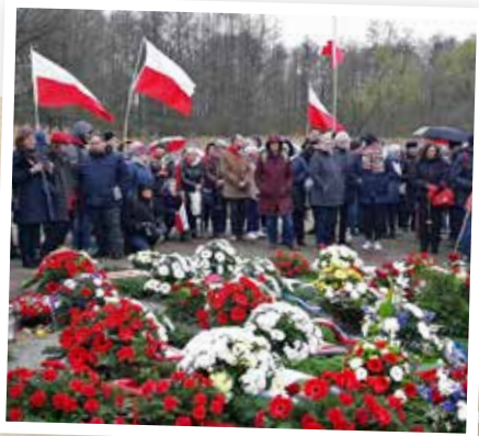
Anhöriga till tidigare fångar samlade i Ravensbrück 2019. En tradition är att lägga rosor i sjön Schwedtsee intill det forna lägret, till minne av offren.

Regelbundet samlas överlevare och anhöriga vid minnesmuseet Gedenkstätte Ravensbrück. Nu i april är det 75 år sedan befrielsen av lägret. De planerade arrangemangen för att uppmärksamma detta har dock i sent skede fått ställas in på grund av det nya coronavirusets spridning.