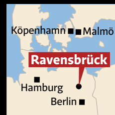
Ravensbrück ligger drygt sju mil norr om Berlin.