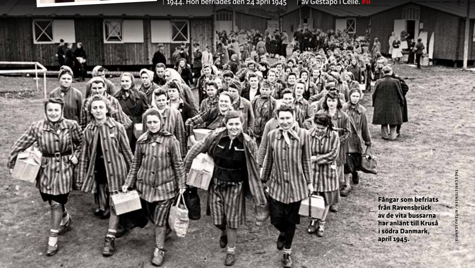
Fångar som befriats från Ravensbrück av de vita bussarna har anlänt till Kruså i södra Danmark, april 1945.