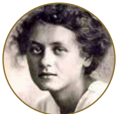
Den tjeckiska journalisten och författaren Milena Jesenská satt i Ravensbrück.

Under en tid sattes temporära tält upp i sumpmarkerna kring den närbelägna sjön. Uppemot tusen kvinnor och barn dog i detta tältläger, inte minst på grund av den extrema vinterkylan 1944 – det fanns inga filter att tillgå.