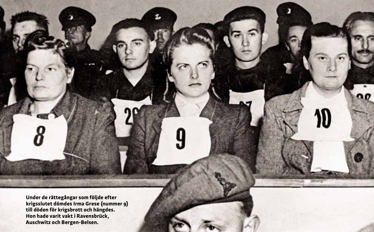
Under de rättegångar som följde efter krigsslutet dömdes Irma Grese (nummer 9) till döden för krigsbrott och hängdes. Hon hade varit vakt i Ravensbrück, Auschwitz och Bergen-Belsen.